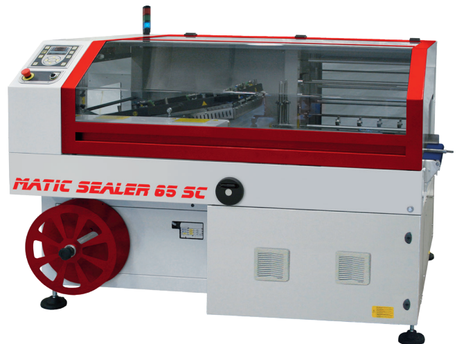
Matic Sealer 65SC