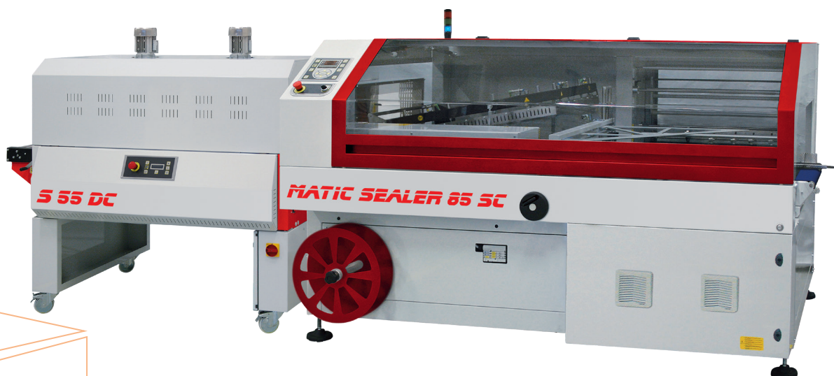
Matic Sealer 85SC + S55DC