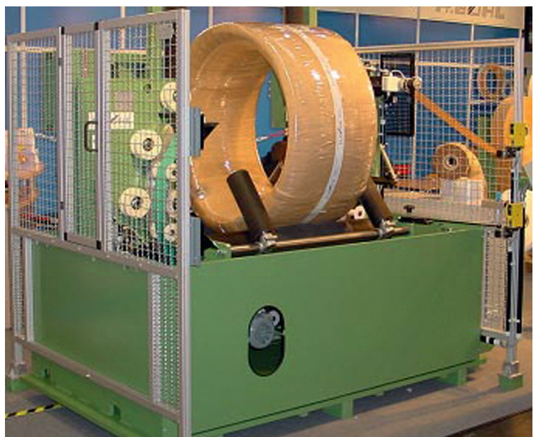
SENIOR/R VA 1M