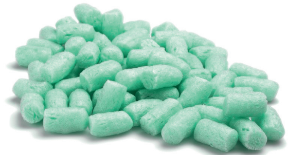
Füllmaterial BIO LooseFill (Art.Nr.: A0225)