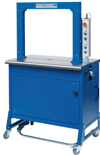
Evolution MP-6 T