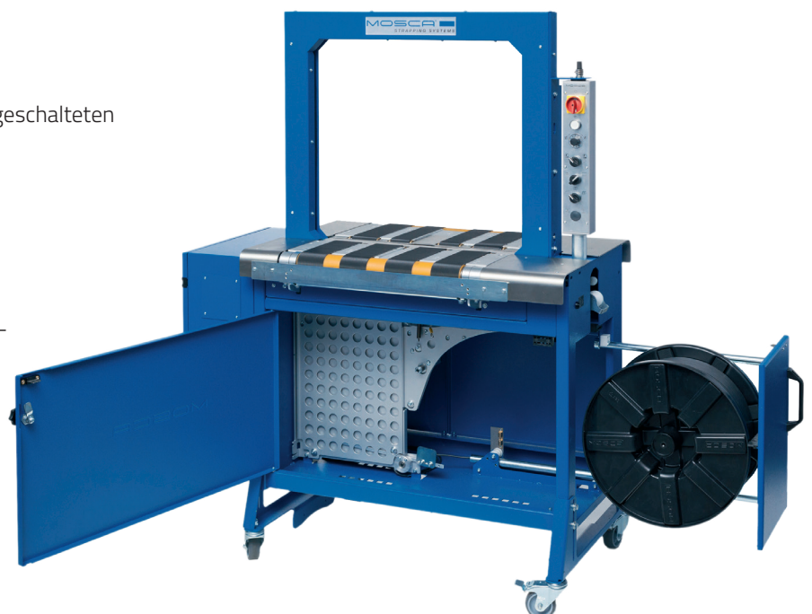
Evolution MP-6 B